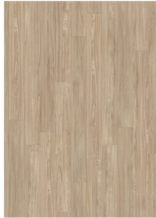
▲ CASABLANCA OAK 24234