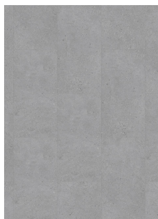
▲ STONE 46996 VULCAN