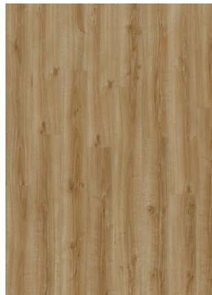
▲ SUMMER OAK 24432