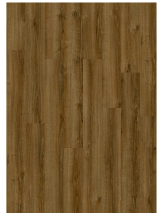
▲ SUMMER OAK 24867