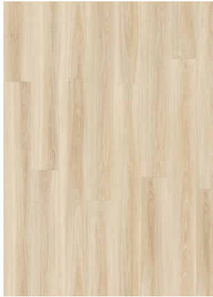
▲ PARIS OAK 22230