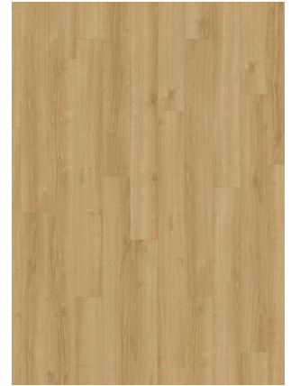
▲ SUMMER OAK 24244