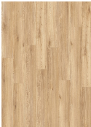
▲ CHAPMAN OAK 24245