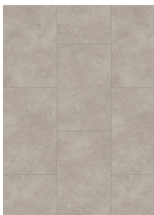
▲ STONE 46953 CEMENT