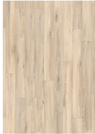
▲ CHAPMAN OAK 24238