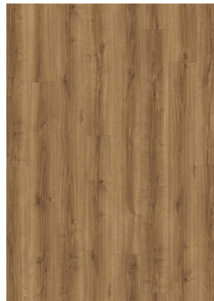
▲ SUMMER OAK 24820